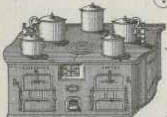
Services de table pour Sociétés, Noces et Communions