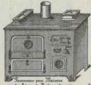
Fourneau pour Maisons particulières et Restaurants