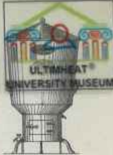
Appareil à lavoir à eau courante