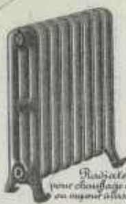
Radiateur pour chauffage à eau chaude ou vapeur à basse pression