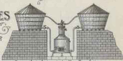
Appareil à lavoir à double Circulation pour Grand Établissement

Monsieur Portin, à Ploudalmézeau pour les articles ci-après détaillés pris et payables dans Nantes. Nantes, le 21 Mars 1909